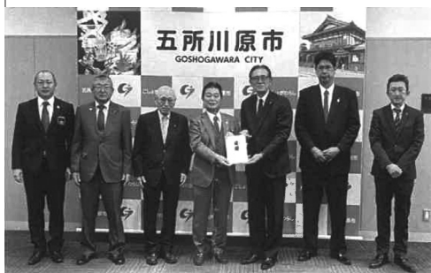
五所川原市への 寄贈