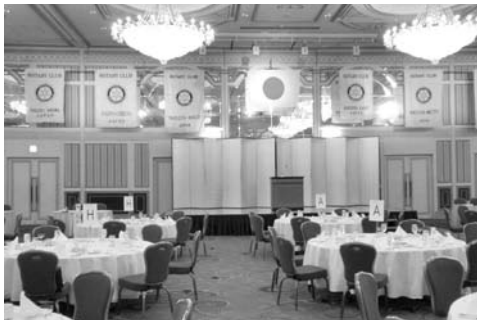
名古屋東急ホテルにて